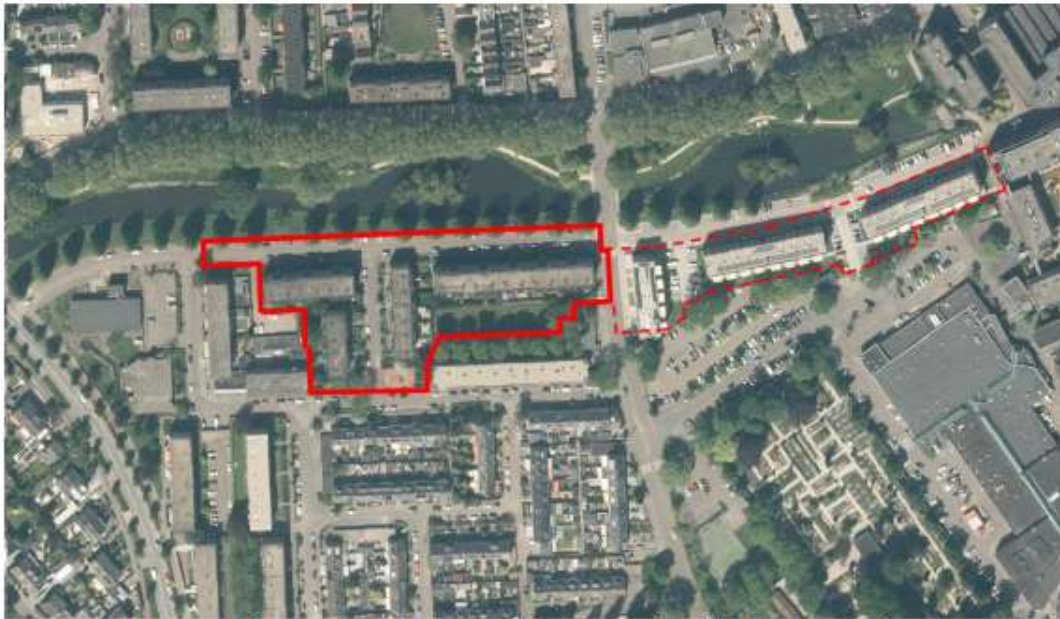
Figuur 1.1 Ligging en begrenzing plangebied (fase 2, rood omlijnd) en fase 1 (rood gestippeld omlijnd)

Het bestemmingsplan maakt het mogelijk om 94 verouderde sociale huurwoningen te vervangen voor 102 appartementen. De globale begrenzing van de planlocatie is in de navolgende afbeelding weergegeven.