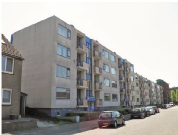
Figuur 2. Overzicht van het projectgebied.

De flora en fauna quickscan richt zich op twee portiekflats in het centrum van Ridderkerk (Figuur 1). De flats dateren uit de jaren vijftig en bestaan elk uit vier woonlagen met een berging (Figuur 2). In de flats is geen lift aanwezig; de woningen zijn bereikbaar via een intern trappenhuis. Zowel aan de voor- als achterzijde zijn de appartementen voorzien van balkons (Figuur 3). De gevels van beide gebouwen bestaan geheel uit kunststofgevelbeplatingen met isolatie (Figuur 4). De naden tussen de gevelplaten zijn dichtgemaakt. Langs de dakrand bij de balkons, een deel van het hek op de balkons en de koof voor de afwatering zijn afgewerkt met trespa platen. De ramen hebben smalle hardhouten kozijnen.