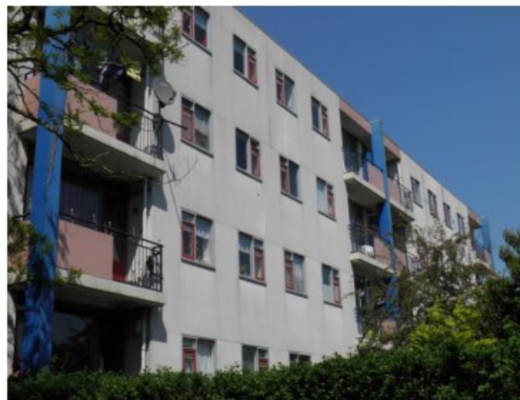
Figuur 3. De achterzijde van de portiekflats.