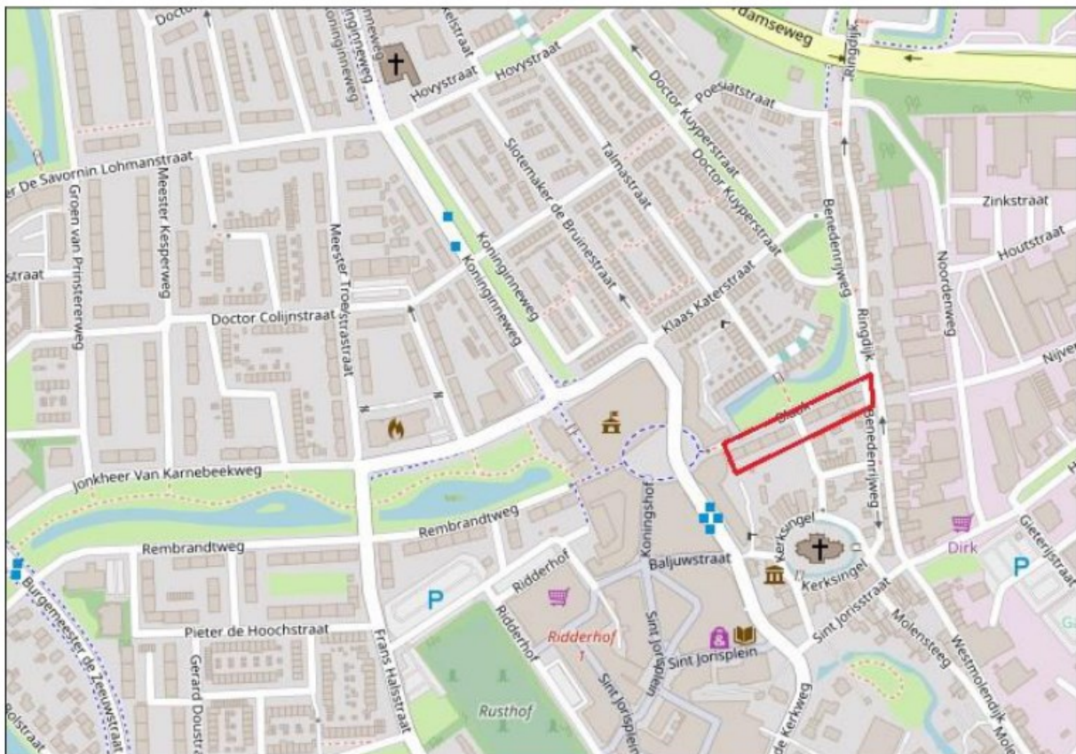
Figuur 1. De ligging van het projectgebied in het centrum van Ridderkerk is aangegeven met een rood kader.

Zowel (grootschalige) renovatie als sloop en nieuwbouw kunnen effect hebben op beschermde soorten uit de Wet natuurbescherming. Daarom was het wenselijk om op voorhand in beeld te brengen wat de kans op beschermde flora en fauna in het projectgebied is. De flora en fauna quickscan is verkennend onderzoek dat hier antwoord op kan geven.