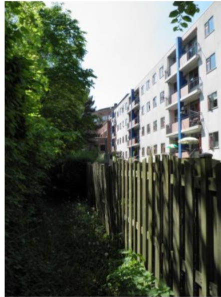
Figuur 5. Langs de achtertuinen vormt een brandgang de erfscheiding met de achtertuinen van de Kerksingel.