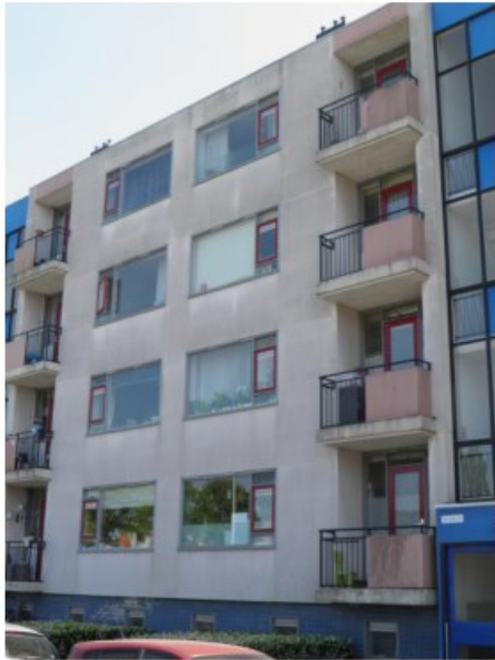
Figuur 4. Vooraanzicht van de noordelijke portiekflat.

Aan de voorzijde zijn kleine plantvakken monotoon ingericht met bodembedekkers of lage struiken. De appartementen op de begane grond hebben een achtertuin. Over het algemeen zijn de achtertuinen groen ingericht met erfscheiding van ligusterhagen en houten schuttingen (Figuur 5). Binnen het projectgebied is geen open water aanwezig.